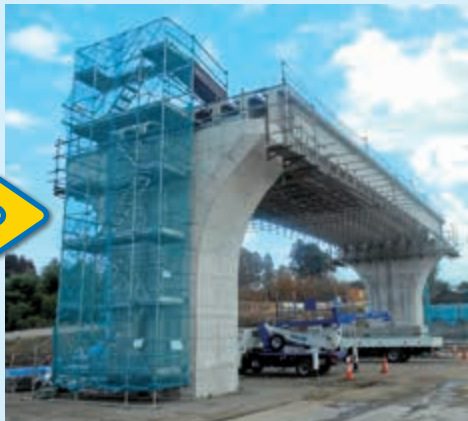
↓清原工業団地方面