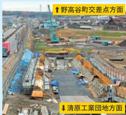
↑野高谷町交差点方面