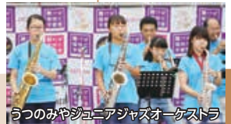
うつのみやジュニアジャズオーケストラ