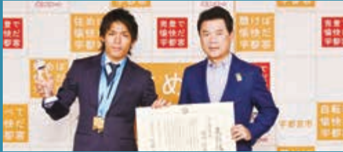
スリーエックススリー

これから、さらに各種目で出場者が決定していきます。宇都宮で育った選手たちが世界に羽ばたきます。ぜひ力強く応援しましょう。