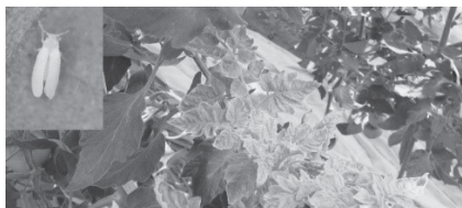
▲トマト黄化葉巻病の葉巻症状とタバコ コナジラミ

ト農家に大きな被害を与えている トマトの重要病害で、トマト生産 者・農協などの関係機関が一体と なって防除に取り組んでいます。