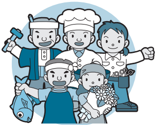
事業所得、不動産所得などの所得がある人

事業所得、不動産所得などの所得がある人は、市から送付する納付書または口座振替などで納めてください。納付はペイジー納付(※)が便利です。納税・税額決定通知書と課税明細書は6月5日、65歳以上の人は6月11日に発送予定です。