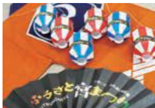
▲ペーパークラフト完成品