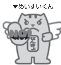
贈らない・求めない・受け取らない