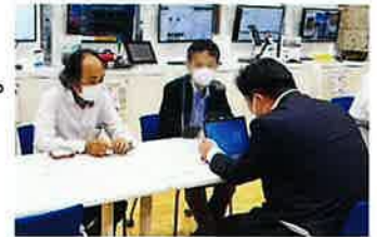
個別相談対応の様子

✓ AI等のデジタル技術が自社の業務にどのように適用できるのか？何が解決できるのか？等の疑問を個別に相談することができます。