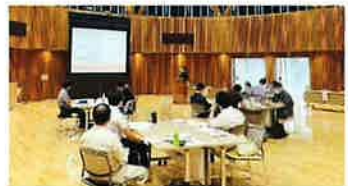
ワークショップの開催

✓ 当センターでは県内支援機関（栃木県産業振興センターなど）の紹介や補助金情報の提供など、AI等のデジタル技術導入に関して、幅広い支援を受けることができます。