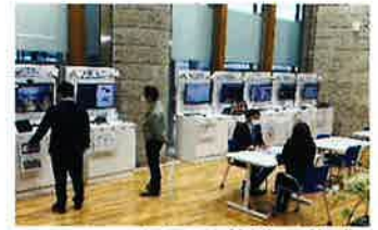
展示スペースでの体験・体感

✓ 展示スペースにおいて、業務の様々な場面で活用できる、AI等のデジタル技術を使った機器を実際に体験・体感することができます。