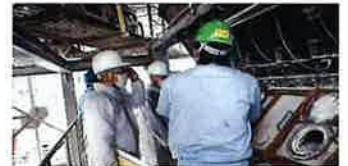
企業訪問・ヒアリングの様子

✓ 当センターで開催する相談会、ワークショップ、人材育成研修等に参加することで、AI等のデジタル技術についての理解と活用を促進できる人材を育成することができます。