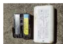
例：モバイルバッテリーなど