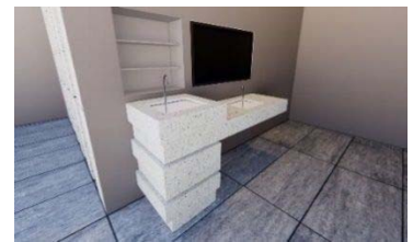
給水スポットのイメージ