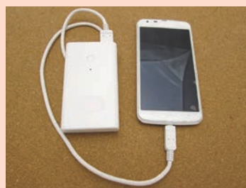
▲モバイルバッテリー

モバイルバッテリーなどのリチウムイオン電池などが使われる小型充電式電池が不用になった場合は、家電量販店などに設置してある「リサイクルBOX」に入れてください。 ごみステーションには出せません。