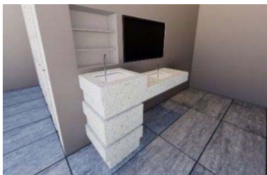
給水スポットのイメージ