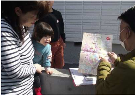
お隣にも続けて加入していただけるよう丁寧に説明しました。

新規転入されたお宅へ自治会加入のご案内パンフレットが役立ちました。 (上戸祭2丁目自治会)