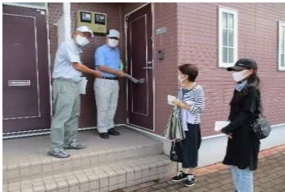
賃貸住宅へポスティングでの加入促進活動