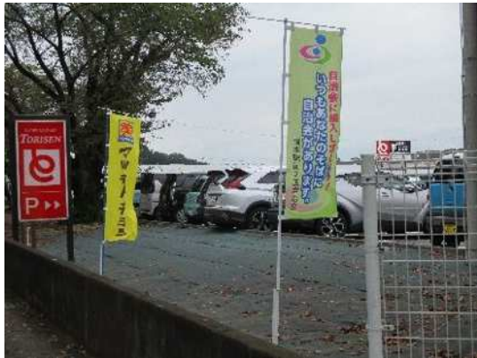
のぼり旗による加入促進（とりせん岡本店）