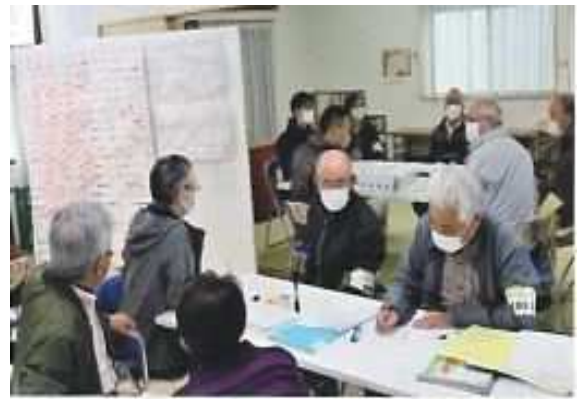
防災訓練（安否確認や被災状況の受付）