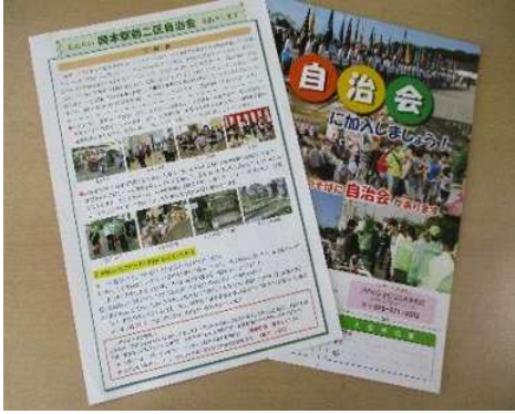
広報用チラシを作成し周知啓発