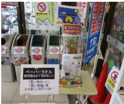
自治会チラシの掲示（たいらや岡本店）