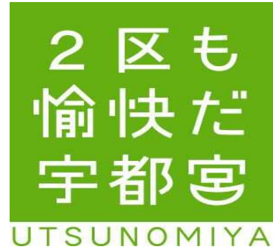
自治会広報資料に宇都宮市ロゴマーク活用