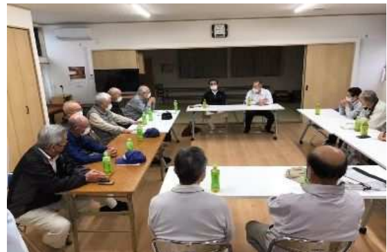
自治会での加入促進事業についての会議