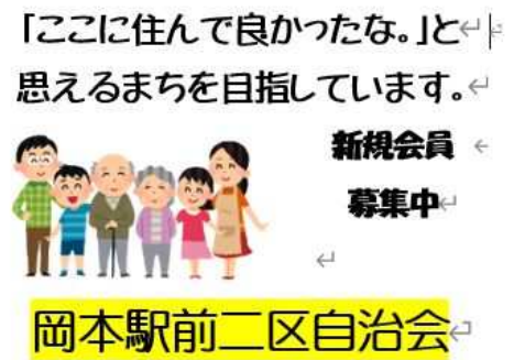
啓発用ポケットティッシュを作成