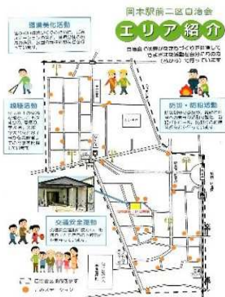
自治会紹介チラシを作成し周知啓発