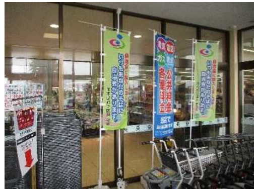
のぼり旗による加入促進（たいらや岡本店）