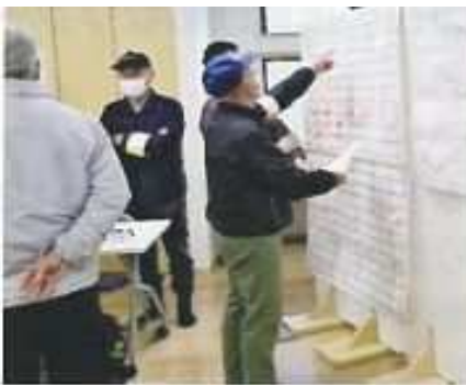
防災訓練（安否状況等を一覧表に掲示）