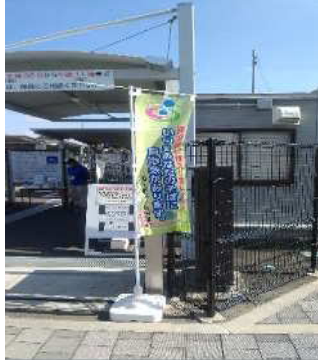
のぼり旗による加入促進（岡本駅前駐輪場）