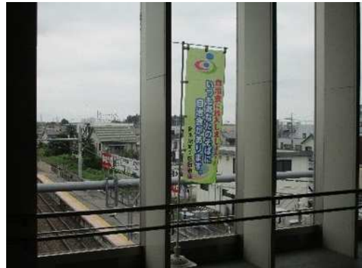
のぼり旗による加入促進（JR岡駅東西通路）