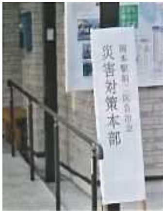
防災訓練（公民館に対策本部設置）