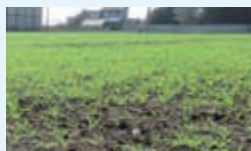
▲カバークロープを導入した農地

▼カバークロープに取り組む 水田で、土壌侵食の防止や有機物の供給による、土壌への炭素貯留などを目的として、主作物の休閑期に栽培できる作物を栽培する。