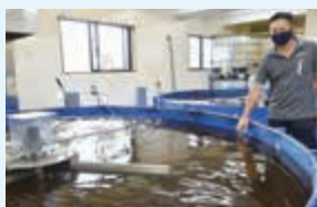
▲店舗横でのエビの養殖