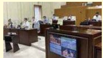
▲視察の様子(久喜市)