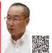
菅野 大造 (公明党)

②設立当初と異なる状況を踏まえ、短期的・長期的に見直すものに選別しながら、市民が安心して利用できる夜休診の在り方を検討する。 ③新型コロナウイルスの診断には、PCR検査と抗原検査が有効とされており、民間医療機関などが休みになる年末年始に抗原検査を実施してきた。今後も状況に応じて必要な検査を実施していく。