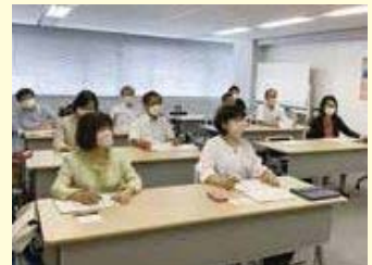
▲視察の様子(神戸市)