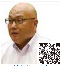
菅原 一浩 (自民党)

宇都宮清原球場では、4年5月にプロ野球公式戦が開催され、県内外から多くの人が観戦した。また、学童野球や高校野球などの数多くの大会が開催されており、10月の「いちご一会とちぎ国体」でも、熱い戦いが繰り広げられるものと期待している。 宇都宮清原球場は、建設後30年以上が経過し、施設の老朽化などが見られており、今後、球場を改修し、施設の機能向上にも取り組むと聞いている。改修に当たり、これまで以上に選手や観戦者が快適に利用できる環境を整えていく必要があると考えるが、市の考えを聞く。