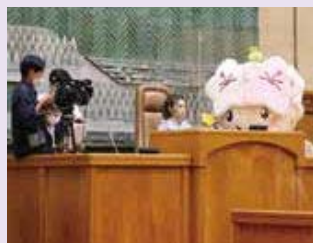
▲議長席での番組撮影の様子