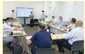
▲視察の様子(京都市)