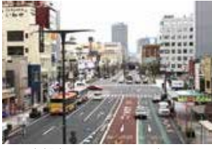
▲JR宇都宮駅西口から見た大通り

況について聞く。 ②また、市の公共交通の基軸となっている路線バス事業者との協議の状況について聞く。