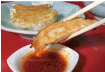
▲ふるさと納税返礼品の餃子

説明 ふるさと納税の申し込みサイト数を拡充したことや、ウェブ広告による告知、返礼品の充実を図ったことにより、市への寄附が増えている。