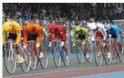
▲宇都宮競輪場でのレースの様子