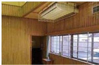
▲小・中学校体育館に設置された空調機器

LRT事業が、費用対効果の検証や民意の確認なしに進められていることや、指定管理者制度については、導入から10年が経過しており、検証や見直しが必要であると考えることから、認定に反対する。