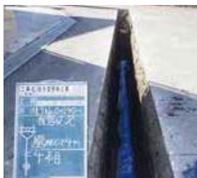
▲老朽管更新の様子

えている。今後も、ポリエチレン管一層管の対策に力を入れながら、漏水量の縮減を進めていきたい。 委員会の結論 起立採決の結果、原案どおり可決及び認定。