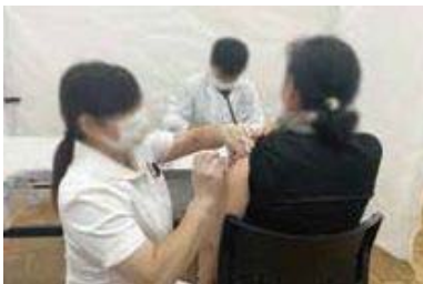
▲新型コロナワクチン集団接種の様子

以上のことから、歳入歳出ともに適正、公正かつ効果的・効率的に執行されたものと高く評価し、認定に賛成する。