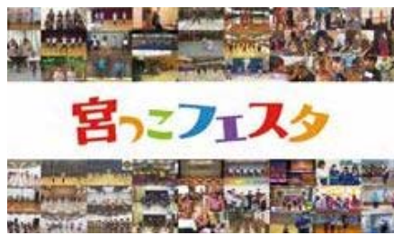
▲オンラインで開催された宮っこフェスタ

説明 宮っこフェスタをオンラインで開催したものであり、宮っこチャンネルと題して、青少年団体や部活動などの日頃の活動成果を発表する機会として動画を投稿してもらっている。この宮っこチャンネルは、65団体548人が参加し、動画については約1万1千回再生されるなど、市民から好評である。