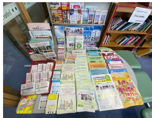
写真2 国際交流プラザ内のチラシ 2022年10月20日

3つ目は、外国人のための日本語教室である。教室では、初級から上級まで様々なレベルに応じ、少人数のグループに分かれて勉強している。日本語レベルに合わせて学習できることで、自分の日本語力に合った学習ができ、また、少人数のグループに分かれて行うことで生徒一人一人に対応しやすくなっている。