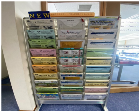
写真1 国際交流プラザ入口付近 2022年10月20日

2つ目は、生活に役立つ情報提供である。写真1, 2で示しているように、国際交流プラザ内や入り口付近に市内のイベント情報やコロナワクチンの情報など生活に役立つパンフレットが置かれている。さらに、パンフレットは日本語で書かれているものだけではなく、英語や中国語など他の言語でも書かれていた。日本語が分からない場合は日本語表記のみのものから情報を得ることが困難であり、生活に必要な情報が届かないということが考えられる。そのため、情報を提供するのに日本語だけでは限界があり、日本語を理解していなくても情報を得られるようにすることが必要である。そのような中で、このように多言語で書かれたパンフレット等があることは、外国人が情報を得るのにかなり役立つと感じ、日本語が分からないことで生活に関する情報を得られないといったことを防ぐ取り組みができていると考える。