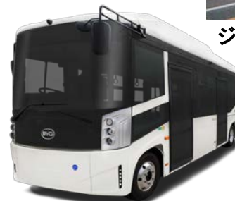
電気バス