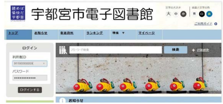
電子書籍サービスの本格実施