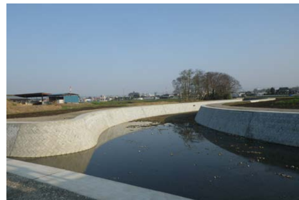
河川の整備(奈坪川)