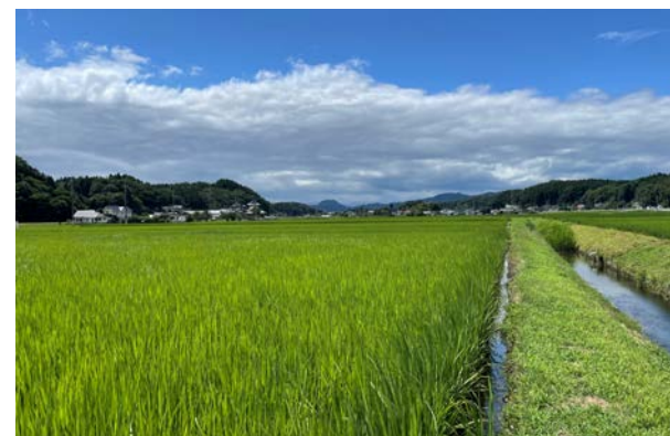
田んぼダムの普及促進(豊郷地区)