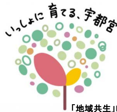
「地域共生」ロゴマーク