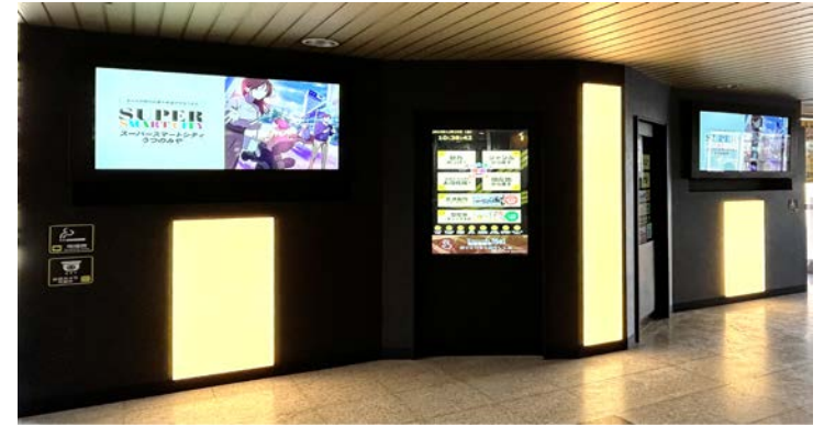
JR宇都宮駅にデジタルサイネージを設置