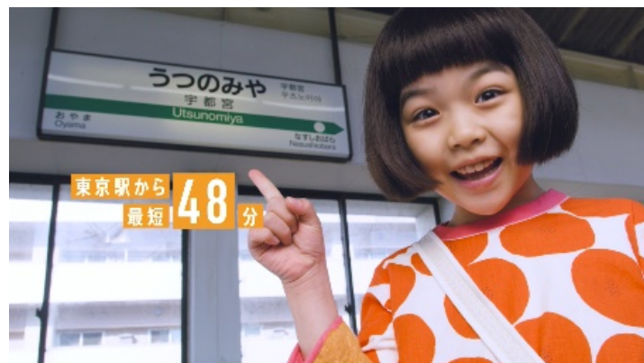
東京圏におけるプロモーション(テレビCM)