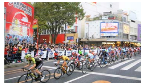
ジャパンカップサイクルロードレース