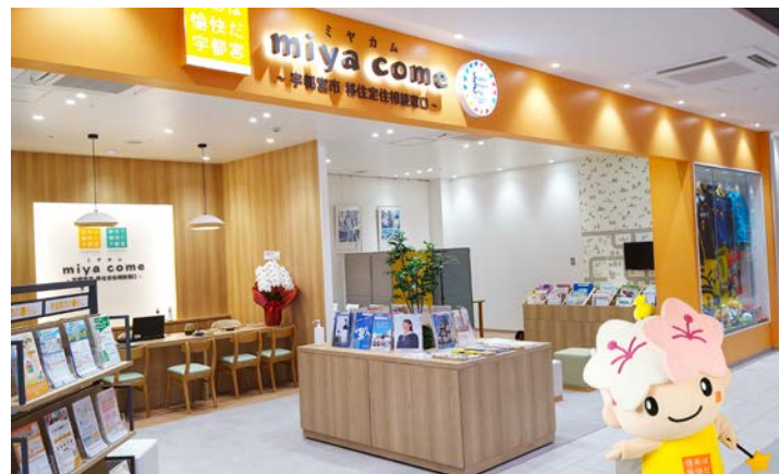
移住定住相談窓口「miya come」