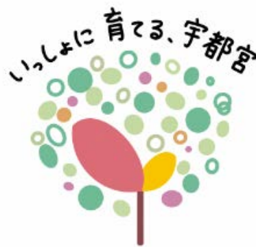
【宇都宮版「地域共生」ロゴマーク】