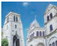
日本聖公会 宇都宮聖ヨハネ教会礼拝堂(左)とカトリック松が峰教会聖堂(右)