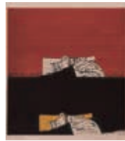
池田満寿夫 《聖なる手1》 1965年 広島市現代美術館

一般=310円、高校・大学生=210円、小・中学生=100円(観覧料)、または企画展チケットでご覧いただけます。