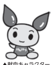
▲献血キャラクター「けんけつちゃん」

皆さんの献血に関する理解、協力が必要。この取り組みとして「愛の血液助け合い運動」が、7月1～31日の1カ月間、全国で展開されます。ぜひ献血にご協力ください。