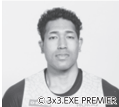
7 ギバ けんキダビング 186cm 100kg