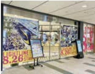
1 宇都宮パセオ(川向町)などをLRT開業仕様に特別ラッピング♪