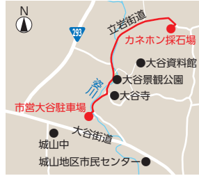
▲今回の走行ルート