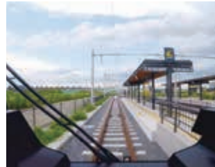
3 車窓からの眺めと各停留場を一足早くお見せします!