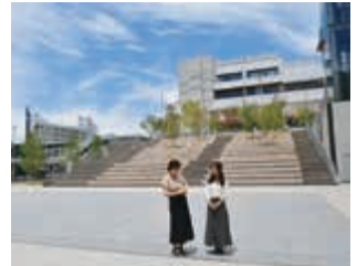
4 発車式が行われるJR宇都宮駅東口で当日に開催するイベントなどを伺いました。