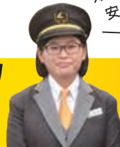
ライトライン運転士