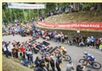
▲路面装飾イメージ