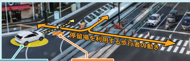
交差点を横切ろうとする車

停留場のある交差点を通行するときは、歩道だけではなく、停留場からの横断歩行者にも十分注意してください。