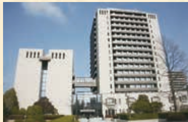
▲現在の宇都宮市役所