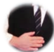
心とつながりのサポート