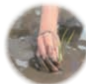
将来の社会的自立 を目指した支援