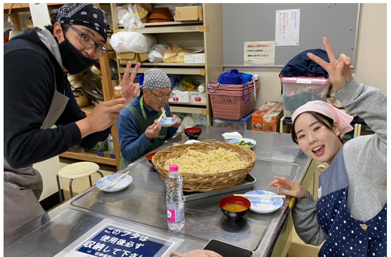
▲できたてのうどんを食べる冒険活動センター職員