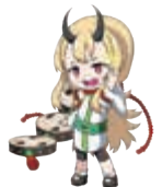
▲宇都宮競輪場キャラクター「らいりん」