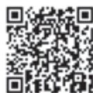
▲申し込みフォームURL

■令和5年度第3回・コレクション展 ▼期間 4月7日まで ▼費用 一般=310円、高校・大学生=210円、小・中学生=100円(観覧料)、または企画展チケットにてご覧いただけます。