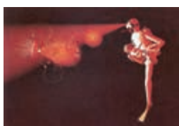
イヴ・ネッツハマー 《身体の外縁》2012年 (映像作品の一場面)

スイス現代美術を代表する映像インスタレーション作家イヴ・ネッツハマーによる日本で最初の個展。代表作とともに宇