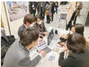
▲商談会での誘致活動