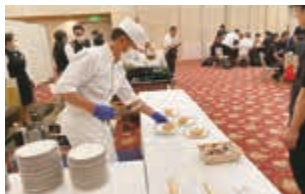
▲焼きギョーザの提供