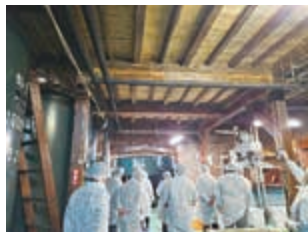
▲酒蔵でのファムツアー