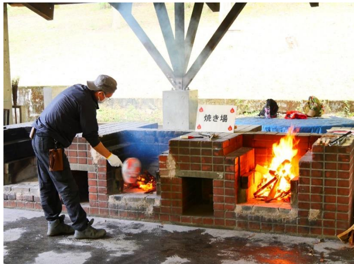
⇒主催事業「子どものもりフェスティバル」にて、かまどで火起こしをしている様子