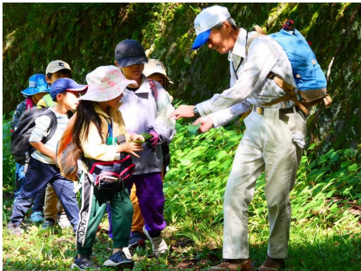
⇒主催事業「ちびっこキャンプ」にて、小学1・2年生と一緒に登山をしている様子