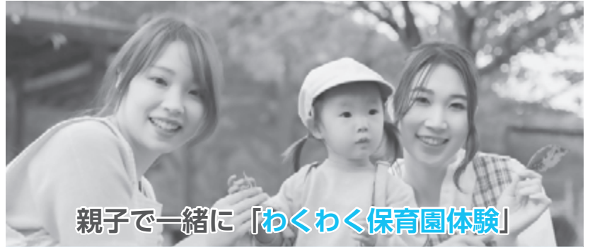
親子で一緒に「わくわく保育園体験」